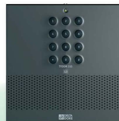
Transmetteur TYDOM 310

Rien de plus simple avec un transmetteur téléphonique TYDOM.