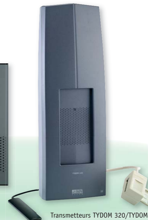
Transmetteurs TYDOM 320/TYDOM 330

Retrouvez tous les détails techniques de ces produits pages 170 et 179.